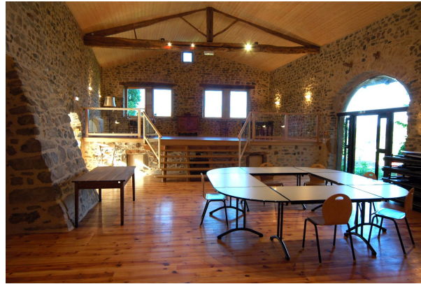
La grange* 140 m 2 pour repas et fêtes