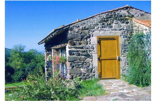
Le fenil* salle polyvalente de 50 m 2